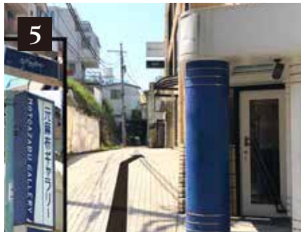
「元麻布ギャラリー」の青い柱の角を右に曲がり20mくらい直進します。