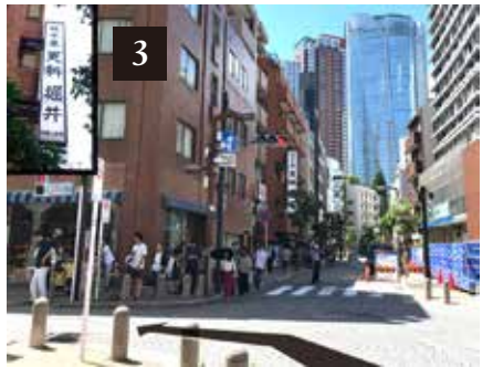
「更科堀井」の看板と、正面に六本木ヒルズが見える交差点を左に曲がります。