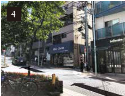
「beillevaire」「Max Game」を超えて暗闇坂を上りながら直進します。