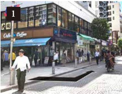
改札を出て「4番出口」のエスカレーターを上がり「Oslo Coffee」を左に曲がります。