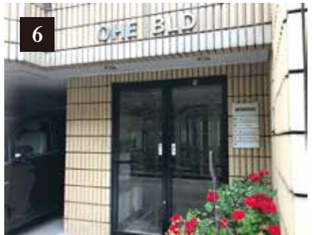
「なかしまや」と「Cross Link」の看板のあるビルが「OHE BLD」です。